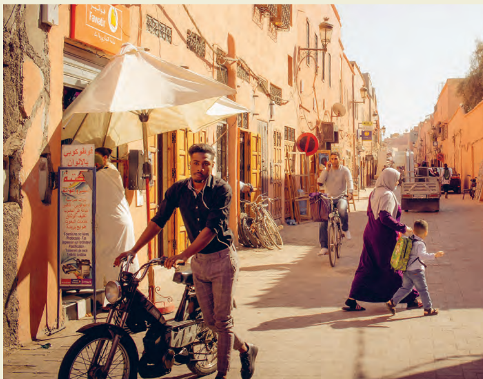
49 av utsendingene til Misjonssambandet i utlandet har tilknytning til sørvest. Noen av disse driver på med teltvirksomhet i områder hvor en åpent ikke kan forkynde om Guds frelse.