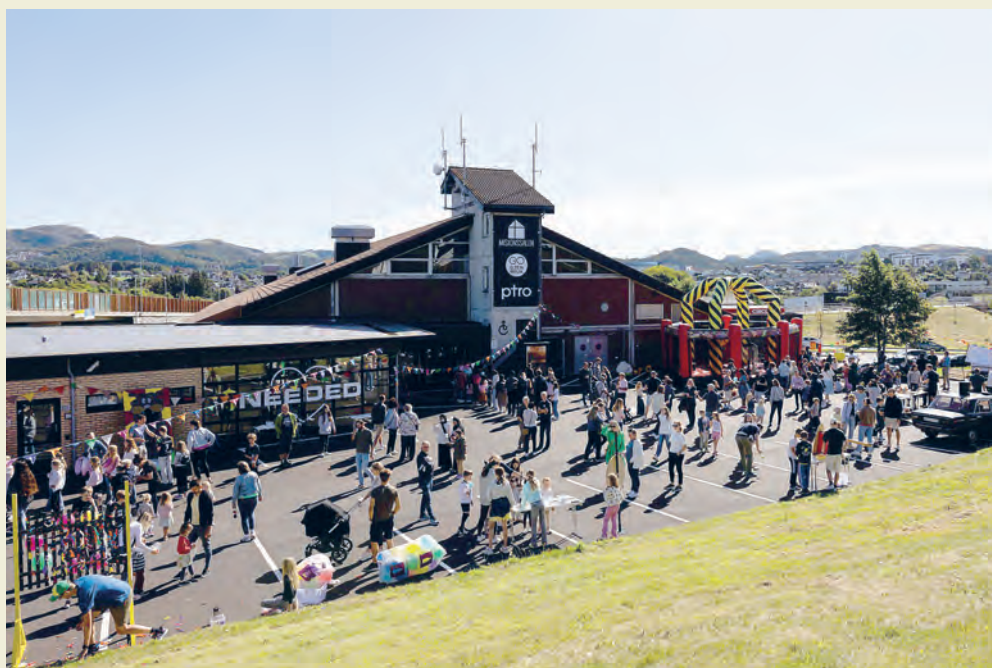
Misjonssalen i Sandnes er et av mange steder hvor Misjonssambandet sørvest driver utadrettet virksomhet. Denne helgen åpnet de dørene for naboen og byen.

Takk til alle som har bidratt til solide inn-