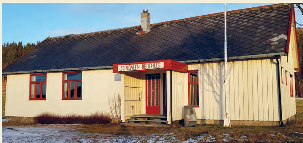
Det 100 år gamle bedehuset i Sør-dalen er fortsatt i bruk.