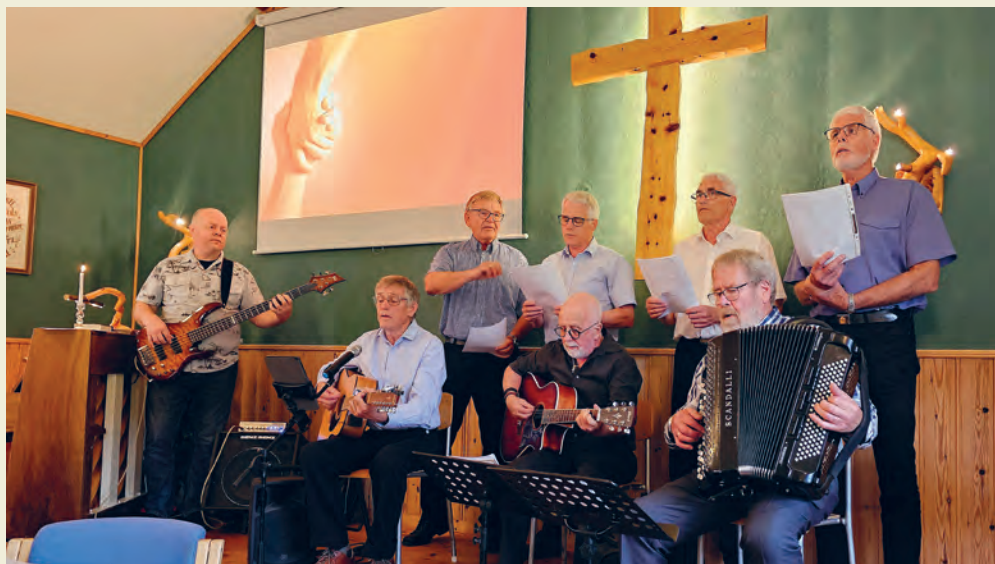
«Leksvik-karran» sang og spilte på festen.

for å ha et godt kristent og sosialt fellesskap. Gjennom det støtter de hverandre og hjelper hverandre på vandringen som kristne. Det samles fortsatt inn penger til misjonens arbeid, og de deltar i forbønn for hverandre og hele bygda, flere burde få et møte med den oppstandne Jesus.