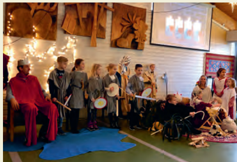
Mange i forsamlinga er engasjert når det vert arrangert julespel på ei av adventssamlingane.

På Vestnes har dei brukt litt ulike opplegg år om anna. Ofte eit julespel i fire akter for dei fire adventssøndagane. Engelen Gabriel og Maria – gjeterane på marka – barnet i krubba i Betlehem – Herodes og vismen-