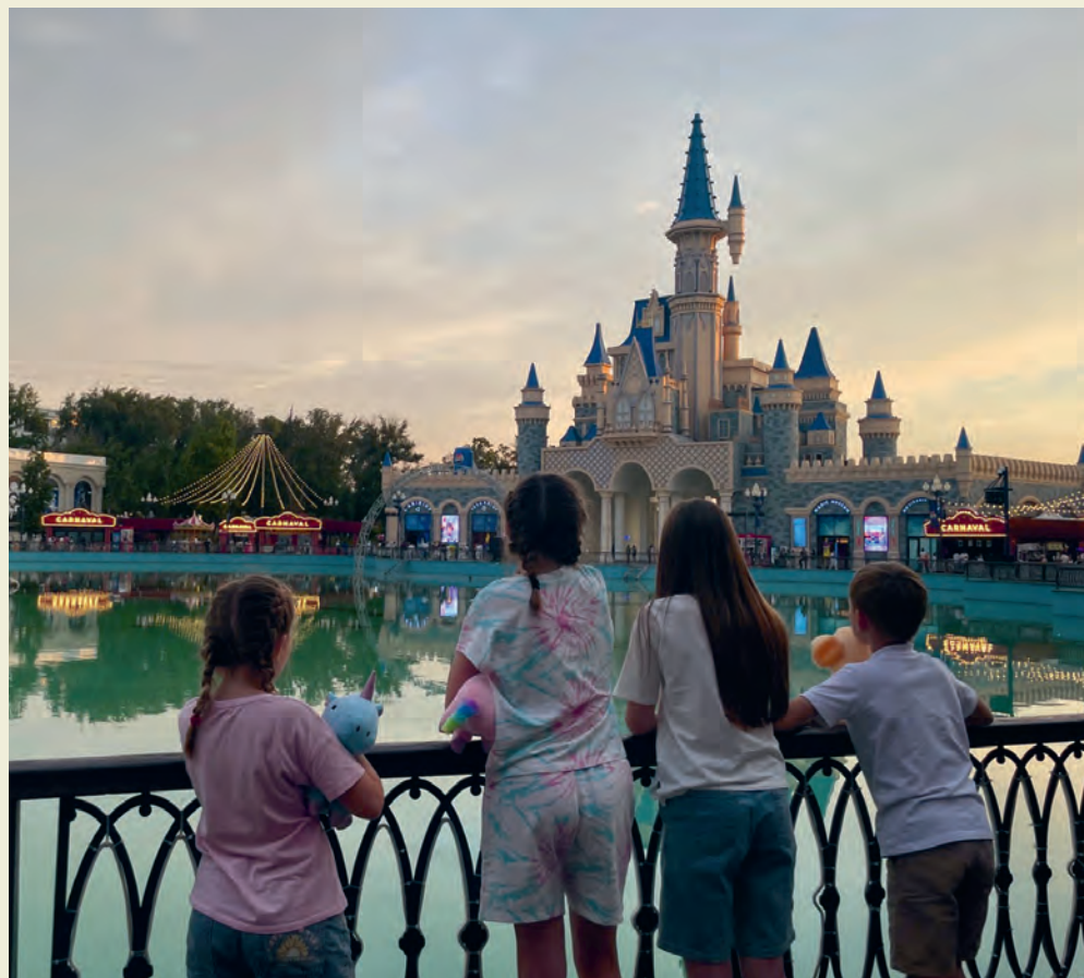
En familie på seks med røtter her i regionen dro i januar til Sentral-Asia som utsendinger.

- Om du skal beskrive kulturen og menneskene dere arbeider blant, hva vil dere trekke frem?