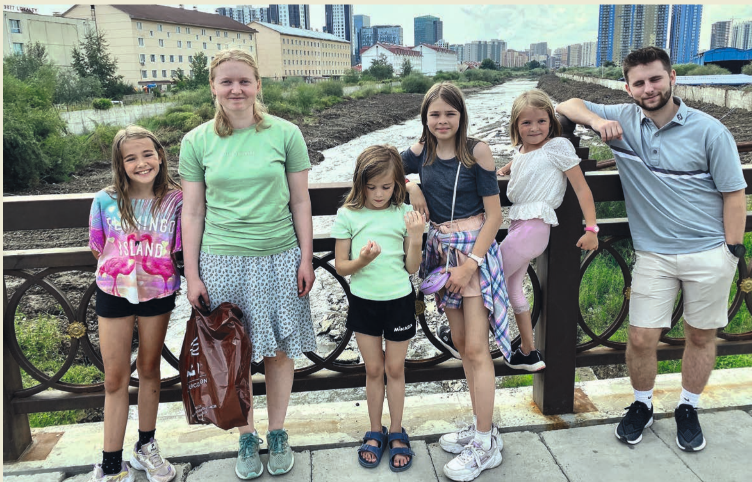
Alle barna i familien Namsvatn sammen med de to ettåringene - i Ulaanbaatar.