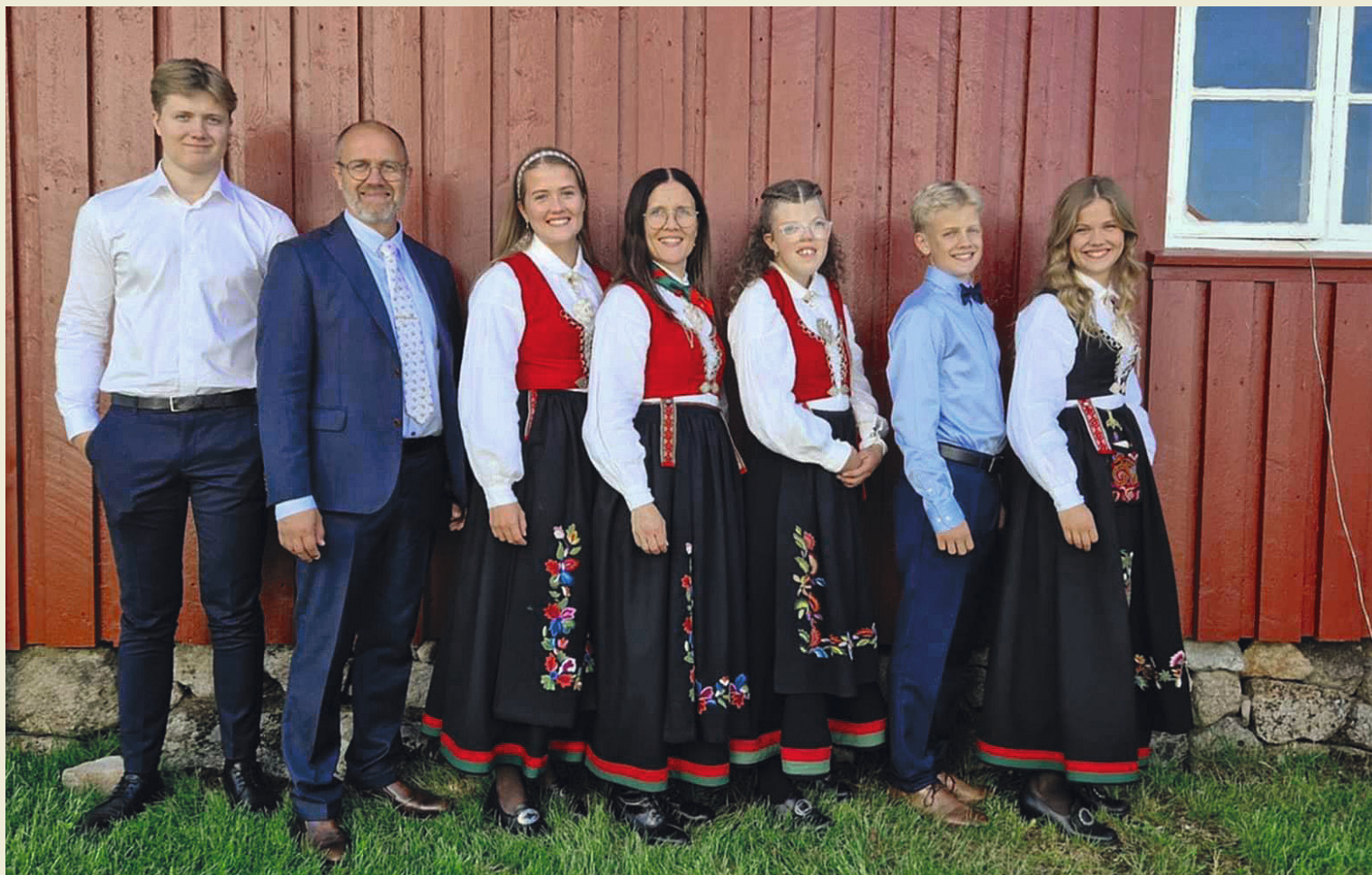
Familien Jonasmo kom hjem fra Mongolia i sommer og har bosatt seg i Namsos.